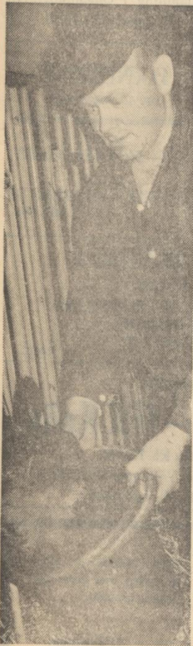
Melker Granberg har många djur att mäta.

Vi räknar med att vanligt helautomatiskt utgödsling fordrar en arbetsgång på 13,5 timmar per ko. Med svämutgödsling beräknar vi att tiden kan pressas ned till 3,5 timmar, omtalar byggnadskonulent Bengt Wiklund vid lantbruksnämnden.