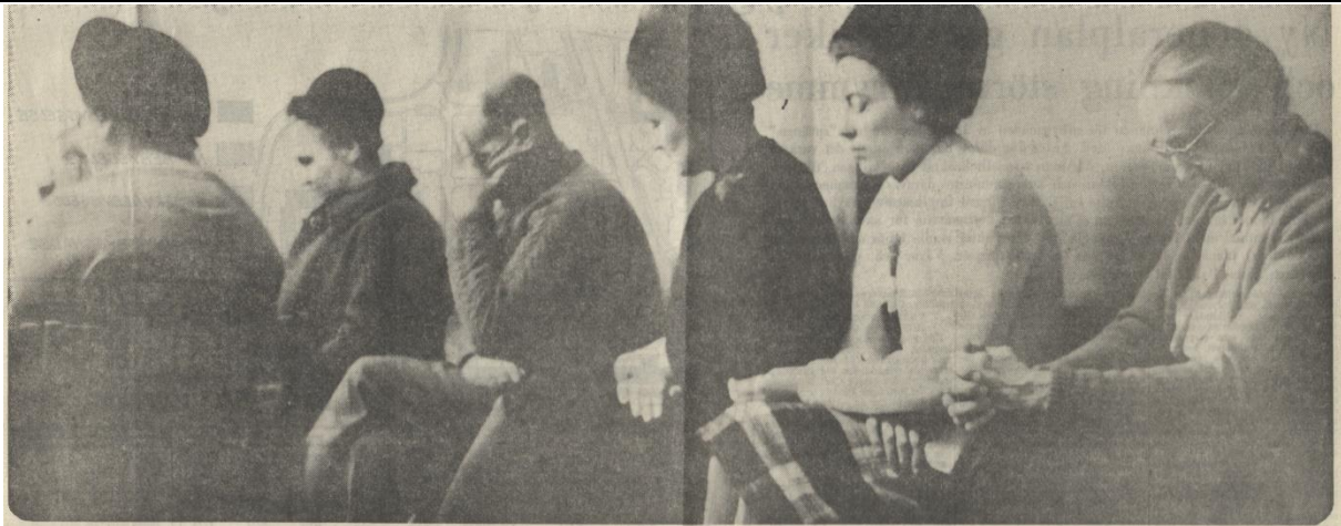
I bön för väckelse. Medlemmar i Nordmalings baptistförsamling förbereder en missionsresa. Det gamla församlingens grepp om bygden sviktar. Men man hoppas kunna vända strömmen.