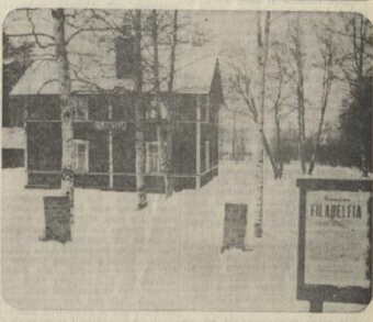
Kapellet i Hörnefors — en kvarglömnd idyll bland björkstammar.

Text: Allan Sandström