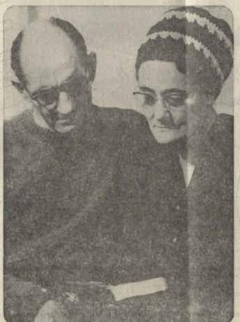
Allvarligt och uppmärksamt följer man med i bibelstudiet